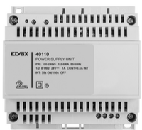
40110 - Alimentation 2F+ 100-240V 1 OUT 1,6A