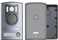
13K1 - Plaque a/v 1 touche alu