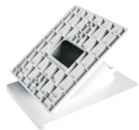
753A - Boîte de table Tab blanc