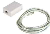
753B - Clou inteconnection base de table