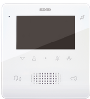
7559 - Portier-vidéo Tab Free 4,3 2F+ blanc