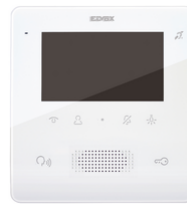
7559 - Portier-vidéo Tab Free 4,3 2F+ blanc