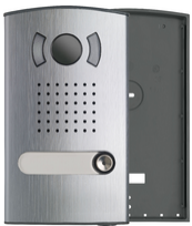
40151 - Plaque audio/vidéo couleur 1 famille