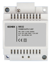
M832 - Transformateur 230V 12Vac 35W