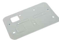
ZX16 - Plaque fix. ACTO 400D/ACTO 600D