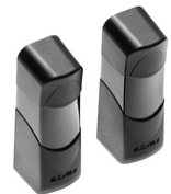
EFA1 - 2 cellules ph. 180° 12/24V 110mA 15m