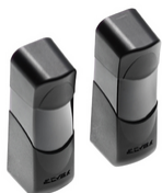
EFA1 - 2 cellules ph. 180° 12/24V 110mA 15m