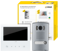
K40517.E - Kit portier-vidéo 1F Tab7SUp Wi-Fi+1300E