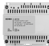
40110 - Alimentation 2F+ 100-240V 1 OUT 1,6A