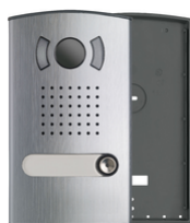
40151 - Plaque audio/vidéo couleur 1 famille