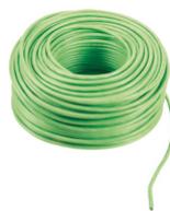
732I.E.100 - 2F+ câble LSZH 2x1 pose extér. Eca 100m