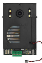
40135 - Unité audio/vidéo 2F+