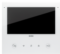
40517 - Portier-vidéo 2F+ Wi-Fi Tab7S Up blanc