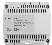
40100 - Alimentation interphon.2F+ 100-240V 0,6A