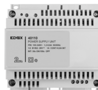
40110 - Alimentation 2F+ 100-240V 1 OUT 1,6A