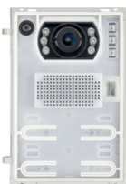
41005 - Unité A/V 2F+ grand angle teleloop