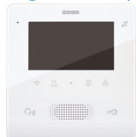
7559 - Portier-vidéo Tab Free 4,3 2F+ blanc