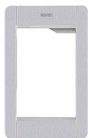
41131.01 - Support+plaque 1M Pixel gris