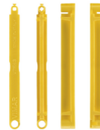
V71563 - Plaquette de jonction boîte enc. jaune