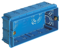
V71305 - Boîte d'encastr.rectang. 5M azur