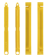
V71563 - Plaquette de jonction boîte enc. jaune