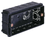
V71305.AU - Boîte d'encastr.rectang. 5M noir