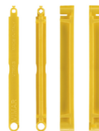
V71563 - Plaquette de jonction boîte enc. jaune