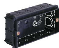
V71305.AU - Boîte d'encastr.rectang. 5M noir