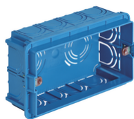
V71304 - Boîte d'encastr.rectang. 4M azur