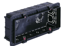
V71306.AU - Boîte d'encastr.rectang. 6-7M noir