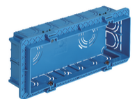
V71306 - Boîte d'encastr.rectang. 6-7M azur