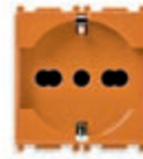
14210.AB.A Presa SICURY 2P+T 16 A 250 V~ universale, arancione - 2 moduli. Prof.tà: 25 mm