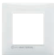
14642.AB.01 2 moduli, bianco