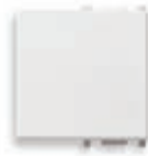
14022.AB Tasto intercambiabile, illuminabile ad anello, neutro - 2 moduli.