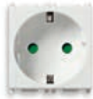
14208.AB Presa SICURY 2P+T 16 A 250 V~, standard tedesco - 2 moduli. Prof.tà: 28,4 mm