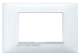
14653.AB.01 3 moduli, bianco