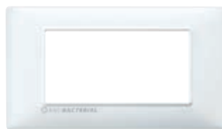
14654.AB.01 4 moduli, bianco