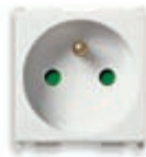
14212.AB Presa SICURY 2P+T 16 A 250 V~, standard francese - 2 moduli. Prof.tà: 25,4 mm