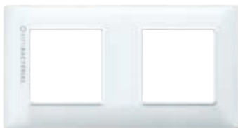
14643.AB.01 4 moduli (2+2 interasse 71 mm), bianco