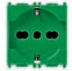
14210.AB.V Presa SICURY 2P+T 16 A 250 V~ universale, verde - 2 moduli. Prof.tà: 25 mm