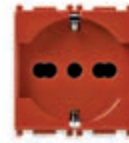
14210.AB.R Presa SICURY 2P+T 16 A 250 V~ universale, rosso - 2 moduli. Prof.tà: 25 mm