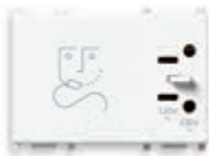
14290.AB Presa per rasoi 230 V~ 50/60 Hz, con trasformatore di isolamento 20 VA, uscite 230 V~ e 120 V~ - 3 moduli. Prof.tà: 41 mm