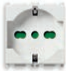
14210.AB Presa SICURY 2P+T 16 A 250 V~ universale - 2 moduli. Prof.tà: 25 mm