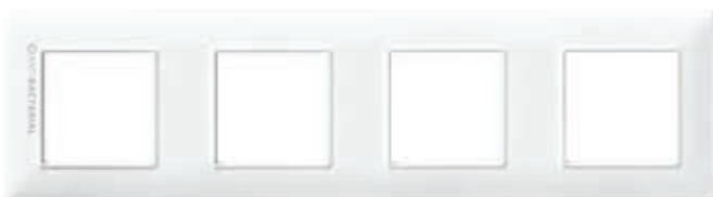
14669.AB.01 8 moduli (2+2+2+2 interasse 71 mm), bianco