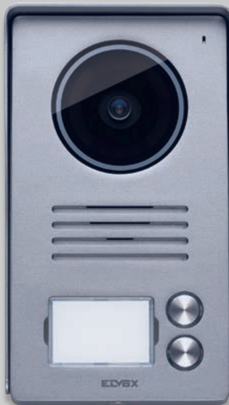
Targa esterna 2 pulsanti