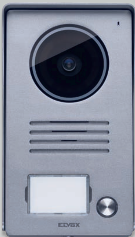
Targa esterna 1 pulsante