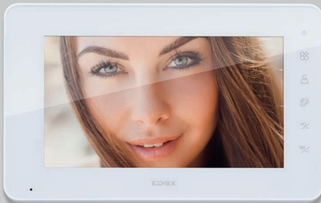
Monitor 7" viva voce a colori