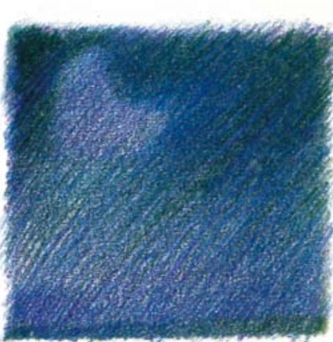
ASSUNTA TOTI BURATTI ITALIA - PREMIO "SANDRO CARLESSO" (46x34) - STRIP