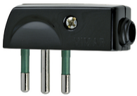
00206 - Spina 2P+T 10A SPA11 90° nero