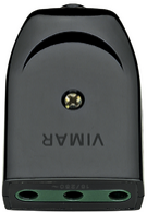
00222 - Preso 2P+T 16A P17 assiale nero