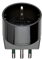
00302 - Adattatore S11 + P30 nero