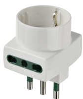
00323.B - Adattatore mult. S17+2P17/11+P30 bianco