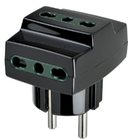
00324 - Adattatore mult. S31+3P17/11 nero