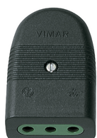
01023 - Presa 2P+T 10A P11 assiale nero