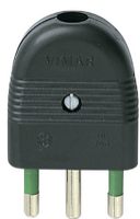
01026 - Spina 2P+T 16A assiale nero