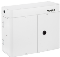
03132 - CSOE modulo di distribuzione