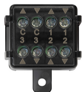
03997 - Modulo centrale Quid tapparelle