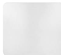
03814 - By-alarm Plus scatola plast. 25-65 zone