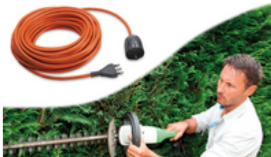
Gamma di prolunghe da giardino.