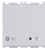
14597.SL - Gateway connesso IoT 2M Silver