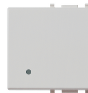
14022.SL - Tasto 2M illuminabile Silver