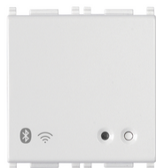
14597 - Gateway connesso IoT 2M bianco