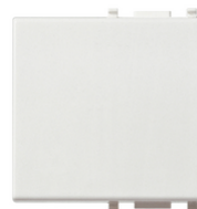
14022 - Tasto 2M illuminabile ad anello bianco