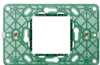
14612 - Supporto 2M centrali +viti