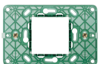
14612 - Supporto 2M centrali +viti