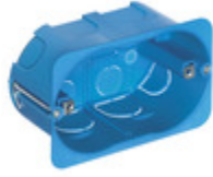
V71703 - Scatola inc. 3M p/leggere azzurro