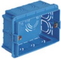
V71303 - Scatola incasso rettang. 3M azzurro