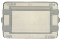
16713.C - Coperchio protezione per 16713