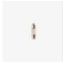
07055 - Lampada siluro incand.24V 3W bianco