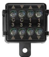
03997 - Modulo centrale Quid tapparelle