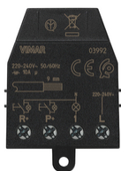
03992 - Modulo relè ad imp. con reset Quid 10A