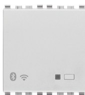
20597.N - Gateway connesso IoT 2M Next