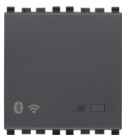
20597 - Gateway connesso IoT 2M grigio