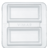
21618.C - Protezione supporto 8M Eikon/Arké/Plana