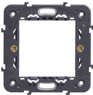
21602 - Supporto 2M con griffe int71