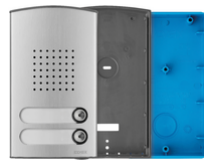
40142 - Placca audio bifamiliare