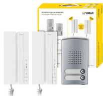
K40540.E2 - Kit citofonico bifam. Voxie 40540+40142