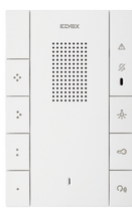
40547 - Citofono vivavoce 2F+ Voxie 7 puls. b.co