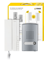
K40540.E - Kit citofonico monof. Voxie 40540+40141