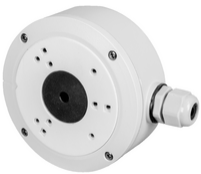
46922.040 - Staffa contatti per telecamera IP