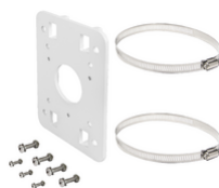
46917.005 - Staffa palo per telecamere IP