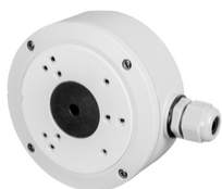
46922.040 - Staffa contatti per telecamera IP