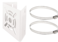
46917.004 - Staffa palo per telecamere AHD FF e VF