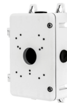
46922.033 - Scatola contatti + alimentatore