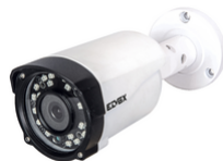
4651.036ES - Tlc Bullet AHD 5Mpx ob. 3,6mm