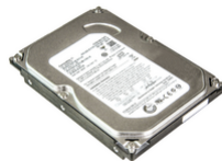
46925.030 - HDD professionale SATA 3,5in 3TB per DVR