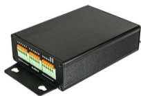
46936.001 - Espansione allarmi USB