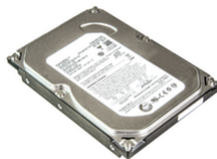
46925.030 - HDD professionale SATA 3,5in 3TB per DVR