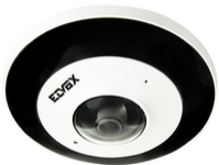
46234.010E.67 - Tlc Fisheye IP 5Mpx FF 1,1mm v 360°