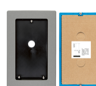
40179 - Kit accessori incasso targa 40170