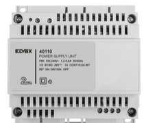
40110 - Alimentatore 2F+ 100-240V 1 OUT 1,6A