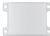
40171 - Kit pulsante monof. per targa 40170