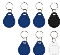
40169 - 7 Chiavette RFID Mifare