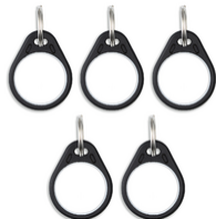
40175 - 5 Chiavette RFID MIFARE