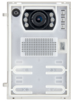
41006.1 - Unità IP A/V teleloop grandangolo