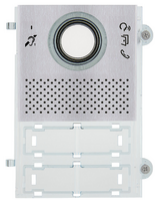
41105.01 - Mod.frontale A/V Pixel Teleloop grigio