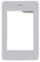
41131.01 - Supporto+cornice 1M Pixel grigio