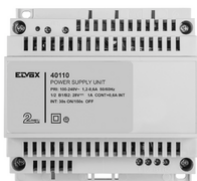
40110 - Alimentatore 2F+ 100-240V 1 OUT 1,6A